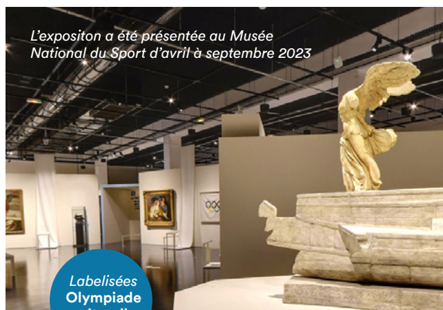
L'exposition a été présentée au Musée National du Sport d'avril à septembre 2023

Avec la collaboration exceptionnelle du musée du Louvre